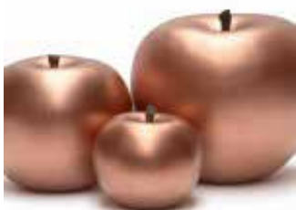
Apple bronze group